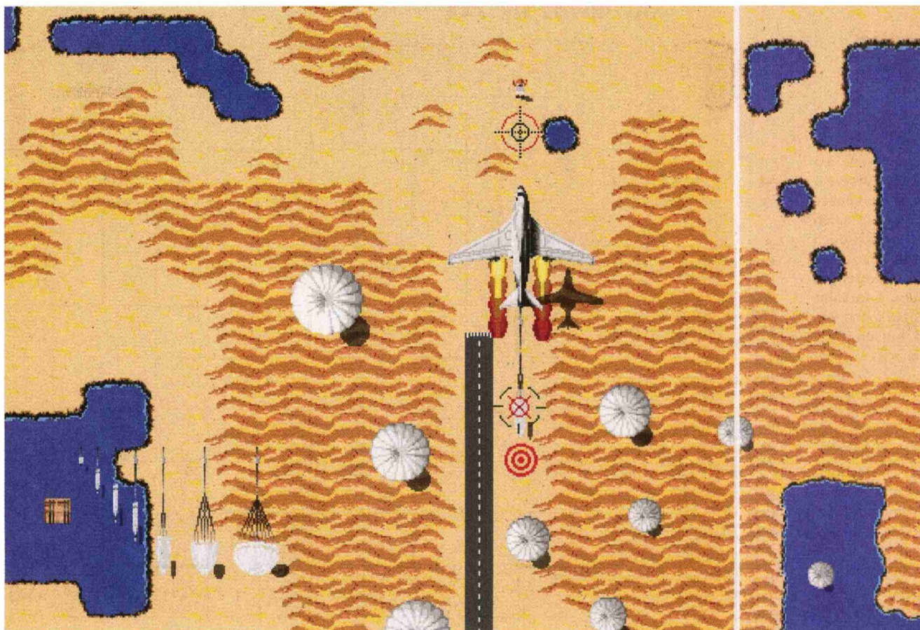
«The Flipside of the Coin»: Die beiden Künstler Hannes Bär und Jonas Oehrli präsentieren am Festival Belluard Bollwerk International in Fribourg ihre Arcade-Spielautomaten.

N° de thème: 34.30 N° d'abonnement: 1093024 Page: 26 Surface: 36'706 mm²